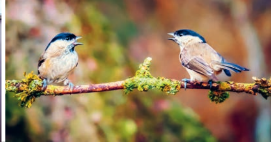
Monatstreff «Drüber rede»