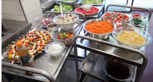
Mittagstisch Sommerfest 2023