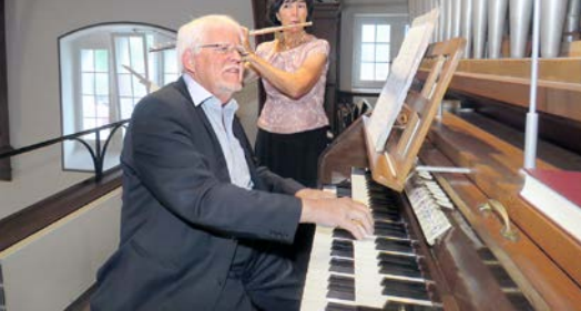
Int. Zuger Orgeltage