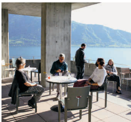
Café auf der Terrasse