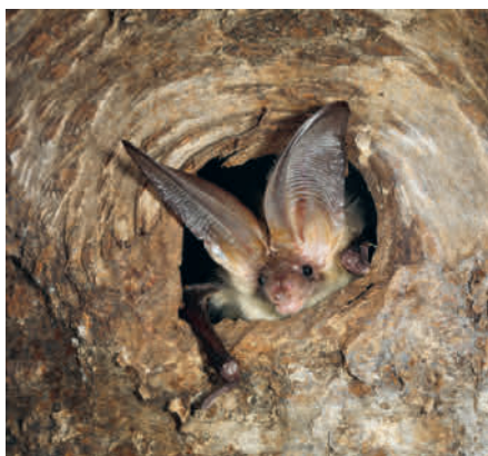
Braunes Langohr ( Plecotus auritus )