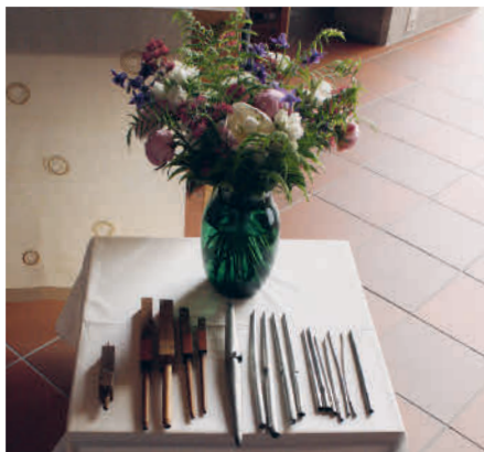
Vorbereitung zur Orgelführung