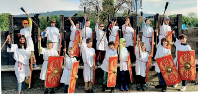
Römisch träumen.