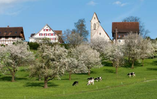
St. Wolfgang Hünenberg.