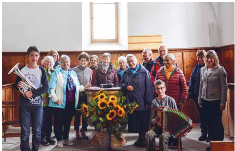
Bild: Teilnehmerinnen Seniorenferien, Kirche Sufers