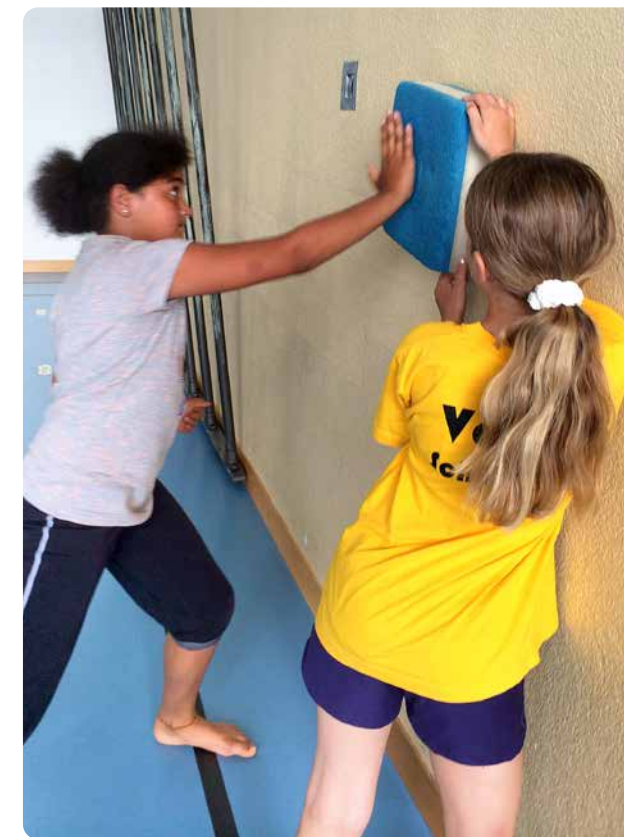
▲ Im Rahmen der Selbstbehauptungskurse lernen die Kinder auch körperliche Abwehrtechniken gegen übergriffiges Verhalten kennen.