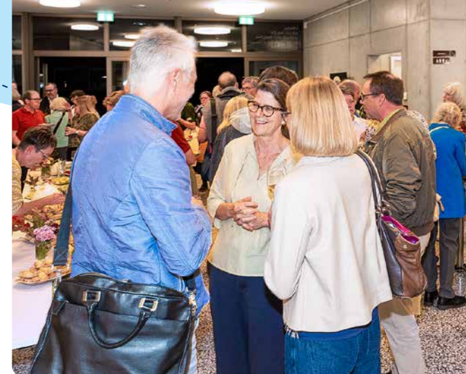
◀ Rege Diskussionen während des erstmals 2025 lancierten Wahlpodiums zur Kirchenratswahl.

2026 setzen wir dort an, wo wir 2025 aufgehört haben. Und wir nehmen das nächste Level der internen und externen Kommunikation ins Visier. Dazu gehören die Zielgruppenorientierung als kontinuierlicher Prozess, die Überwindung von Silodenken und Binnenperspektive beim kirchlichen Arbeiten sowie die Weiterentwicklung unserer Website.