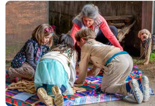
▲ An der Langen Nacht der Kirchen fanden Kinder, Jugendliche und Erwachsene Angebote, die zusammenführten.

2025 setzten wir unseren zuvor eingeschlagenen Weg fort, die Kommunikation konsequent auf die Bedürfnisse unserer Zielgruppen auszurichten – von der Innensicht zur Aussensicht. Besonders erfahrbar wurde dies im Rahmen der Neuentwicklung unserer Website.