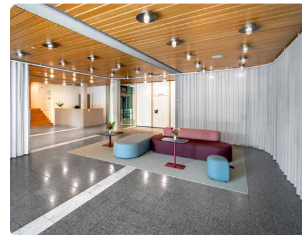
▲ Zahlreiche Um- und Neugestaltungen machen das Kirchenzentrum Ägeri zu einem einladenden und inspirierenden Begegnungsort.

Nach 40 Jahren ohne grundlegende Renovierung ist es Zeit für die Sanierung des Kirchenzentrums Baar . Die Planungen für die Erneuerung der Lichttechnik und der Bodenbeläge sowie die der sanitären Anlagen wurden 2025 aufgenommen und werden aktuell fortgeführt.