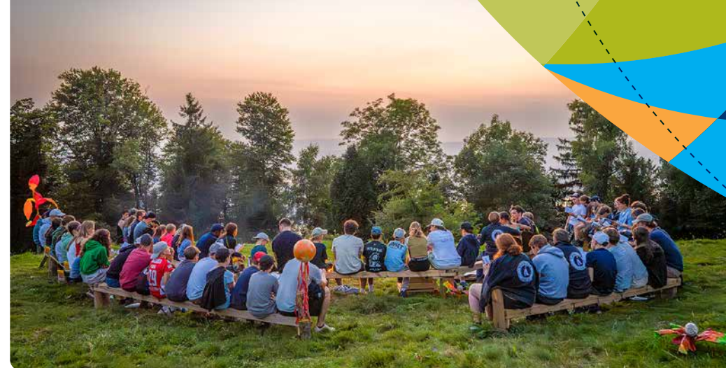
▲ Mit einem stimmungsvollen Sonnenuntergang klingt ein Tag am Sommerlager in Ägeri aus.