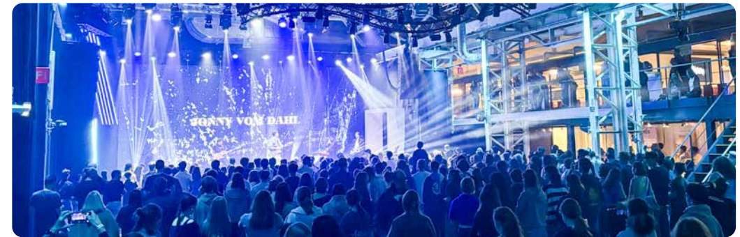
▲ Festivalstimmung mit Livemusik begeisterte unsere Konfklassen und Unterrichtsgruppen am Jugendfestival «REFINE» in Zürich.

2025 war ein Jahr mit viel Dynamik: Verbesserungen bei Stellvertretungen, eine starke Präsenz unserer Konf- und Unterrichtsgruppen etwa am Jugendfestival «REFINE» sowie neue Impulse in der Kirchenmusik prägten das kirchliche Leben. Gleichzeitig sorgten Veränderungen in der Fachstelle Religionspädagogik für Schwung und belebten die ökumenische Zusammenarbeit.