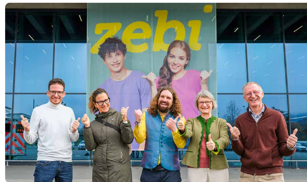
▲ Die Zentralschweizer Landeskirchen werben an der Bildungsmesse zebi für kirchliche Berufe.