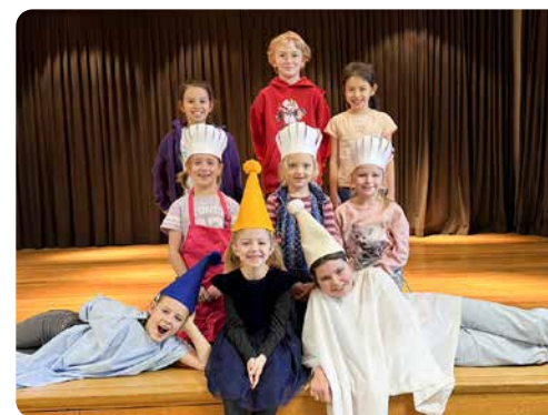
▲ In der Vorweihnachtszeit übten Kinder in Menzingen ein Krippenspiel ein, das am 14. Dezember aufgeführt wurde.

Wir fördern Weiterbildung und setzen uns dafür ein, den Beruf Sozialdiakonie im Rahmen der Zusammenarbeit mit weiteren Zentralschweizer Kantonen bekannt zu machen. Derzeit evaluieren wir, inwieweit es möglich ist, Schnuppermöglichkeiten für junge Menschen anzubieten, die vor der Berufswahl stehen oder für ältere, die sich beruflich neu orientieren.