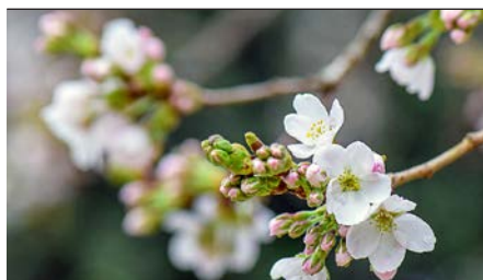
cherry blossom

Auskunft: Hanspeter Kühni, Sozialdiakon, 041 726 47 22 hanspeter.kuehni@ref-zug.ch