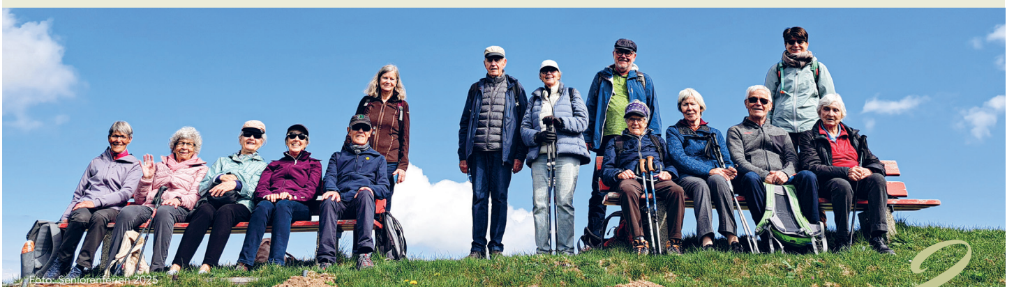
Foto: Seniorenferien 2025

Als neues Projekt wurde 2025 die Trauerstube an der Eichengasse 9 ins Leben gerufen. Jeden 1. Samstag des Monats hatten Trauernde die Möglichkeit, sich mit anderen Betroffenen auszutauschen und fachliche Unterstützung zu bekommen.