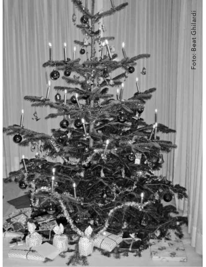
Vor 350 Jahren noch angefeindet: der Weihnachtsbaum.