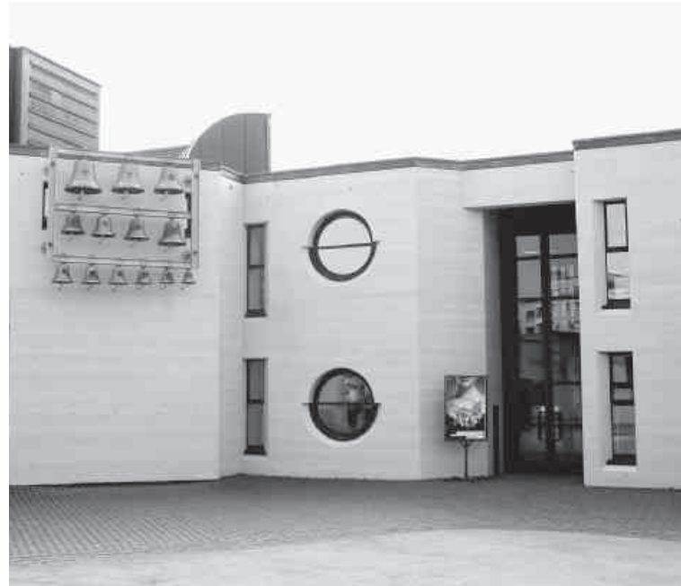
Das Kirchenzentrum «Chilematt» ist gleichermaßen für Katholiken und Reformierte das spirituelle Zuhause.

Es gehört zum guten Ton, dass die reformierten und katholischen Kirchen trotz aller Unterschiede den Schulterchluss üben und sich ökumenisch engagieren. Dass dies in der Praxis nicht immer ein Zuckerschlecken ist, zeigt sich bei genauerem Hinsehen.