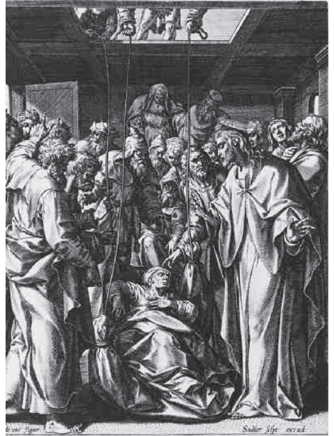
«Heilung eines Gichtbrüchigen» – Kupferstich von Rafael Sadeler, einem Mitglied der berühmtesten flämischen Kupferstecherdynastie aus dem 17. Jahrhundert.

Niemand, der diese Gabe ernsthaft praktiziert, wird medizinische Diagnosen oder Prognosen stellen. Er wird sich