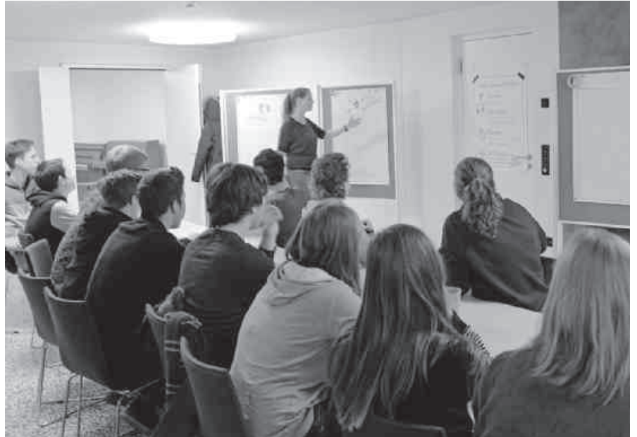
Die Jugendlichen werden stets dazu angehalten, Verantwortung zu übernehmen sowie sich aktiv in die Aktivitäten einzubringen.